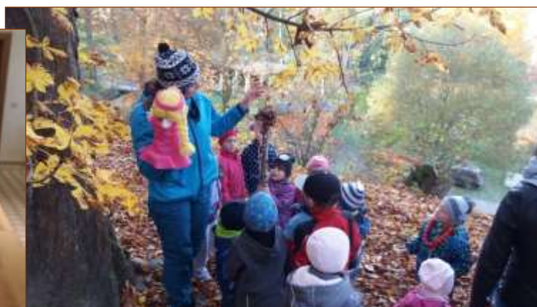
Programy pro žáky ZŠ – Bečovská botanická zahrada