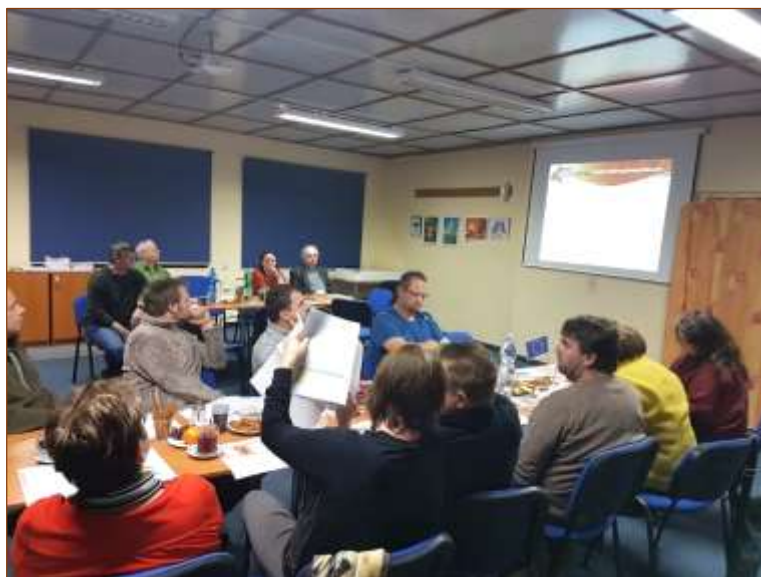
Informační seminář k PRV 16. ledna 2018