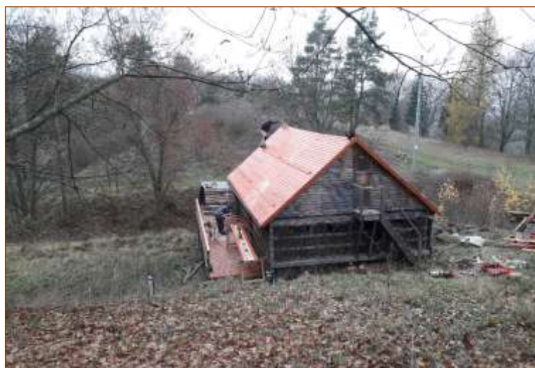
Cyklistická infrastruktura – katovna na Zlatém vrchu

Výše dotace: 200 000 Kč (Karlovarský kraj; 74,82 %)