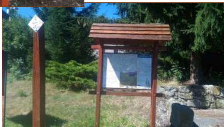
Krajem živých vod – Zahrádka