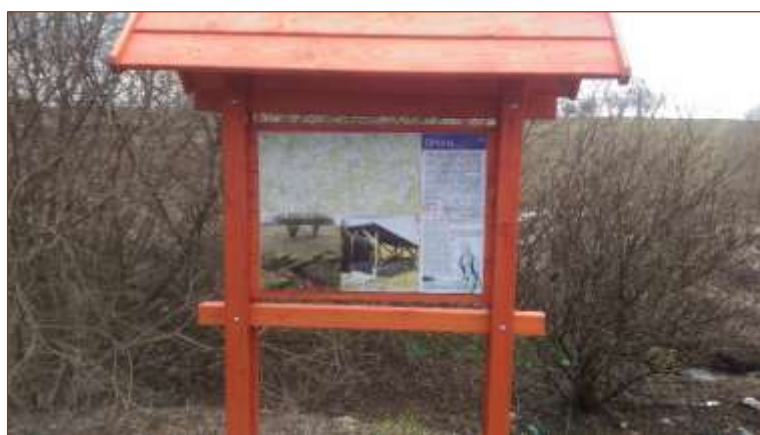
Krajem živých vod – informační tabule Oriona

Výše dotace: 64 000 Kč (Karlovarský kraj; 75,96 %)